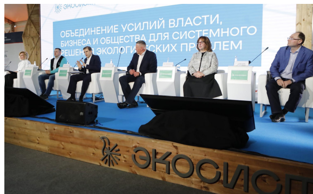
Прототип коллекции КЕЙС – серия СИТИ - на Всероссийском молодежном экологическом форуме «Экосистема». Вологодская область, 2021г.

Коллекция КЕЙС создана на основе предыдущей серии диванов и кресел СИТИ, она стала ее улучшенной версией. В коллекции КЕЙС сохранены модели с компактными габаритами. Также линейка дополнена моделями со стандартными параметрами.